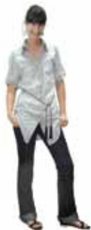
Cécile COTTIN-DUSART Mobilité / Mobility